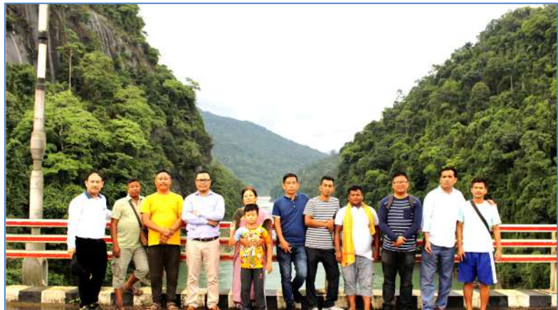
At Wahrew Bridge, Bholaganj with Bholaganj Development Society on 18 May 2022