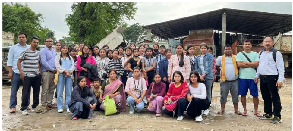
At Bhologanj with Bhologanj Development Society on 17 May 2022