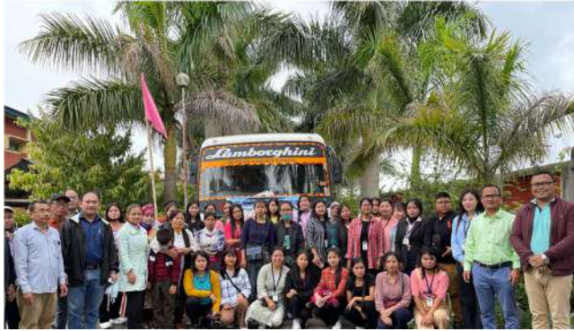
Starting from College on 16 May 2022