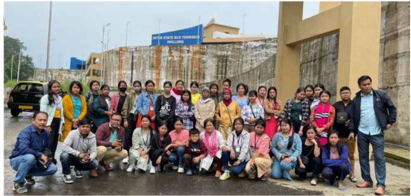
ISBT Shillong on 17 May 2022