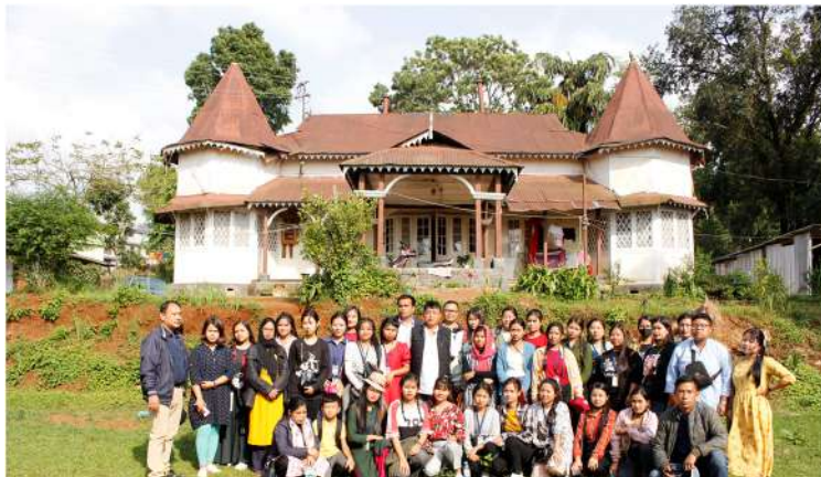
Group Photo with Caretaker OSD at Manipur Rajbari, Meghalaya on 18 May 2022