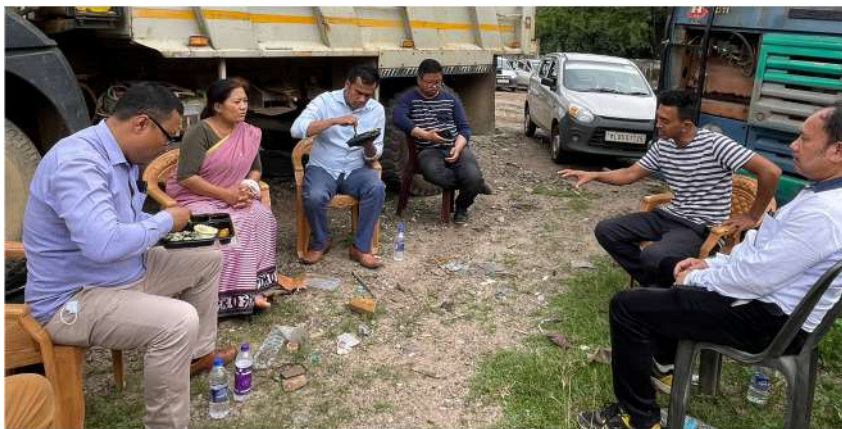
Interaction with Bhologanj Development Society on 17 May 2022